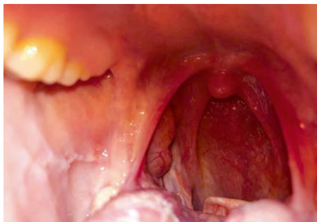
Рисунки 3, 4. Небные миндалины после лечения.

На 10-й день после обращения в поликлинику осмотрена врачом общей практики: состояние удовлетворительное, сохраняется потеря вкуса и обоняния, температура тела 36,7 °С. Со слов больной, она принимала курс Цефиксима ЭКСПРЕСС, а фавипиравир принимать не стала. Дыхание через нос свободное, при осмотре глотки: слизистые розовые, налета на небных миндалинах нет, размер миндалин значительно уменьшился (рис. 3, 4). По органам патологии нет: дыхание в легких везикулярное, ЧДД 16 в мин, насыщение крови кислородом, по данным пульсоксиметрии, 98%.